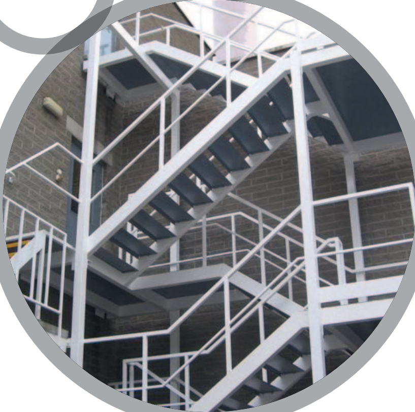
Escaliers de secours

Pour plus de renseignements sur les produits Belzona, veuillez contacter: