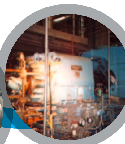
Bacs de condensat