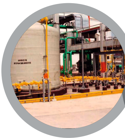
Réservoirs de stockage