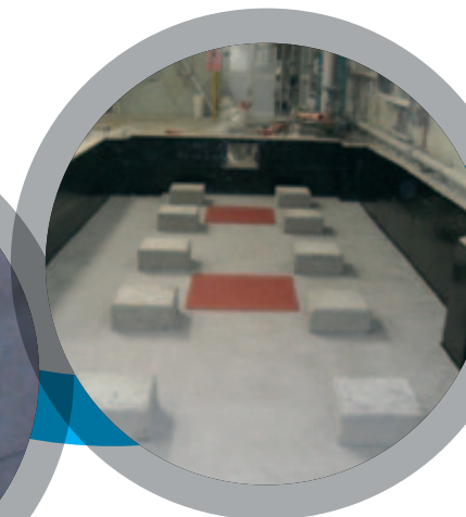
Bacs de rétention