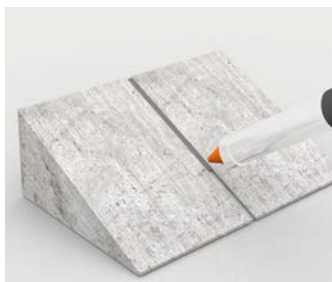
Mastic pour joints sur les rampes d'accès en béton