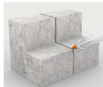
Mastic pour joints sur les gradins et les marches

Pour plus d'informations, contactez votre représentant local Belzona :