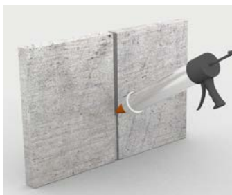
Mastic pour joints de dilatation sur les structures verticales