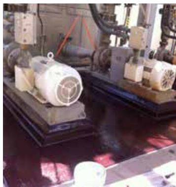
Application facile au pinceau qui protège diverses géométries contre les attaques chimiques

Belzona 4311 peut résister aux fortes compressions et charges exercées par la circulation de véhicules et de piétons.