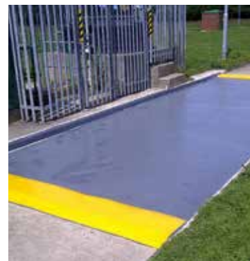
La haute résistance à la compression est idéale pour les zones de chargement ou de remplissage de produits chimiques