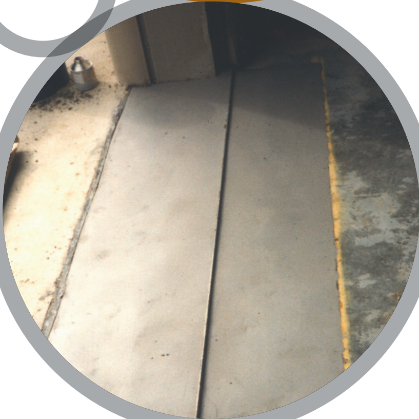
Surfaçage de sols

Pour plus de renseignements sur les produits Belzona, veuillez contacter: