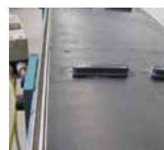
Matériaux différents liés par un joint étanche