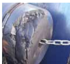
Pièce endommagée reconstruite