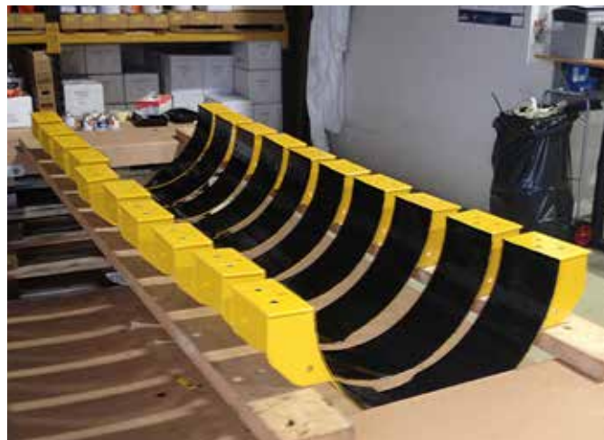
Éléments de serrage destinés aux zones d'action des vagues enduits