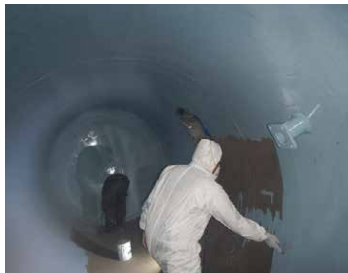
Belzona 1391T appliqué manuellement

Pour plus d'informations, contactez votre représentant local Belzona :