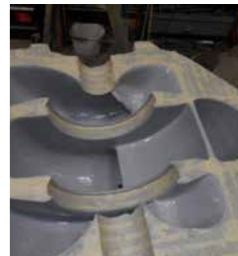
Revêtements de pompes