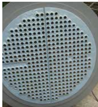
Protection des échangeurs thermiques

Ce système sans solvant est appliqué avec des outils manuels simples aux zones nécessitant une résistance maximale à l'érosion.