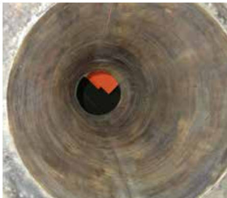
Cône en acier avant revêtement