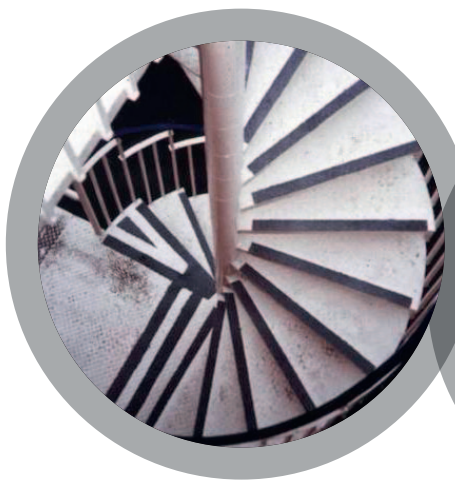
Escaliers de secours