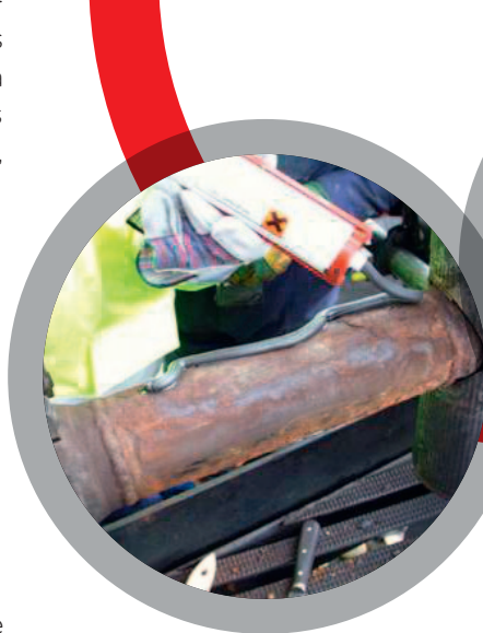
Collage de plaques de renfort