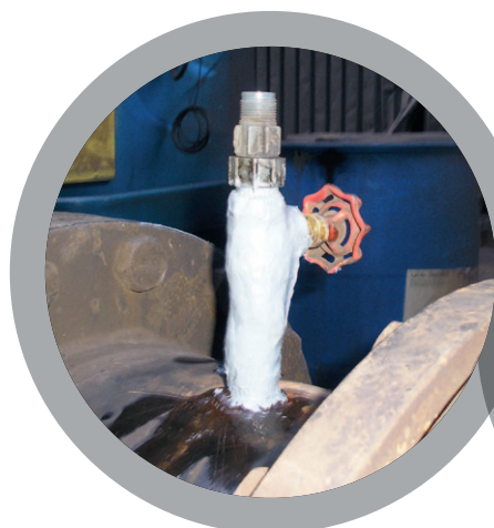
Étanchéité de fuites de canalisations