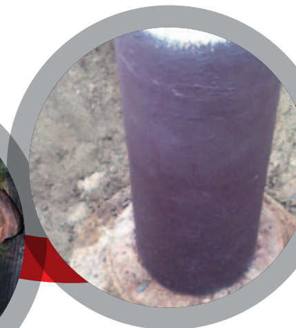
Réparation de défauts au niveau de parois minces